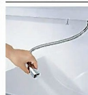
ホースを引き出して使えるので、ポウル手前流水を流すこともできます。