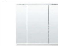
スリムLED照明・3面鏡・全収納 MEB-753TXJU