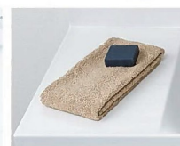
カウンターは 仮置きスペースにピッタリ。