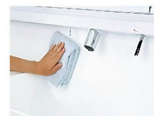
一体成形カウンターで お手入れ簡単。