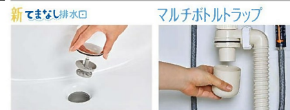
排水口の中でスポンジでサッとお掃除できます。 トラップのお掃除まで簡単 水を通しやすい口径φ55の排水口です。