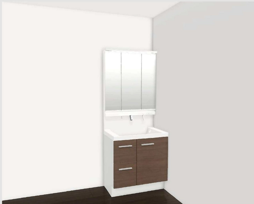
CG合成によるイメージ画像です。