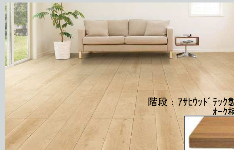
階段：アサヒウッドテック製 オーク柄