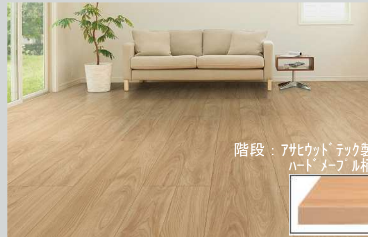
階段：アサヒウッドテック製 ハードメープル柄