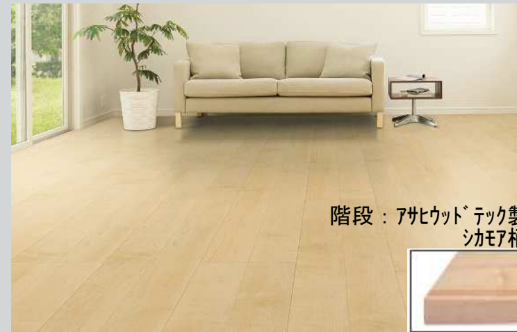
階段：アサヒウッドテック製 シカモア柄