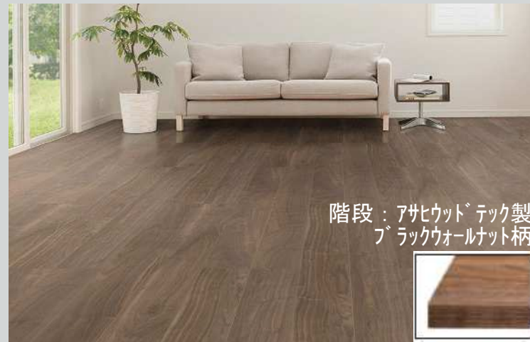
階段：アサヒウッドテック製 ブラックウォールナット柄