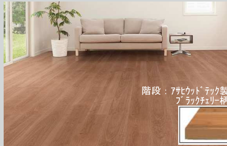
階段：アサヒウッドテック製 ブラックチェリー柄