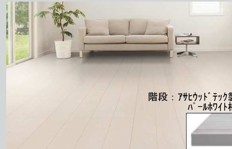
階段：アサヒウッドテック製 パールホワイト柄